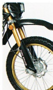
کمک فنر جلو