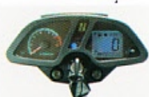
صفحه کیلومتر دیجیتال