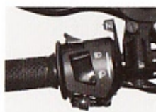
ساسات روی فرمان