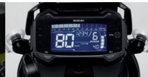
صفحه کیلومتر LCD کاربردی، نمایش وضعیت دنده میانگین مصرف سوخت، دور موتور و ...