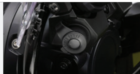
خروجی برق DC در حین حرکت ۱۲ V / ۳۶ W، در حالت درجا ۱۲ V / ۱۳ W